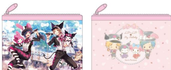
フラットポーチ 【2種 各 980円税抜】

株式会社 TWIN PLANET(本社：東京都渋谷区、代表取締役：矢嶋 健二)は、株式会社サンリオ(本社：東京都品川区、社長：辻 信太郎、以下 サンリオ)と共同で商品化企画をおこなう、人気クリエイターユニット「HoneyWorks」とサンリオの人気キャラクター「マイメロディ」「クロミ」とのコラボグッズを、サンリオピューロランドで展開するコラボイベント「HoneyWorks × My Melody in サンリオピューロランド」で先行販売いたします。