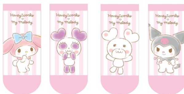
ソックス 【2種 各 400円税抜】

先行販売は、2018年6月30日(土)～7月20日(金)の期間でサンリオピューロランド 3F エントランスショップにて実施いたします。ラインナップは、ポーチやミラー、クリアファイル、ソックスなどを中心とした日常使いできるグッズを多数ご用意しております。