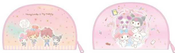
シェル型ポーチ 【2種 各 1,300円税抜】