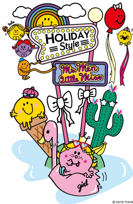
「ホリデースタイル」